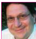
Γιάννης Ζέρβας , Καθηγητής Ψυχιατρικής ΕΚΠΑ