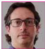
Διονύσιος Βαϊδάκης , Χειρουργός Μαιευτήρας - Γυναικολόγος, Επίκουρος Καθηγητής Πανεπιστημίου Λευκωσίας